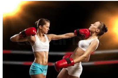
Vị trí của mình ở nơi nao?

Vị trí của mình, phải đào sâu Tìm ra thế giới, của chính mình Ai động, ai tịnh, ta thời xét Nghiêm minh tự trị, quán lấy ta