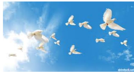
Vượt Thiên Đàng

Tham thiên mới diệt, được u minh Tiến sâu vào giới, cảnh thanh bình Trong đó Bác tìm, lại lẽ sống Du dương tâm thức, vượt thiên đàng