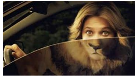
Sư tử Hà Đông

Con người, sư tử, giống hệt nhau Chỉ muốn hung hợn, thích lấy lừng Tâm đạo hiền hòa, nên nung nấu Lâu dần ý chí, Phật đổi thay