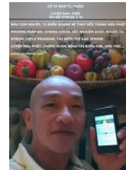
Tôi đo độ stress 1%

Thanh lọc hạ thừa, phải đào sâu Đó là căn bản, pháp điển thiên Từ đó bộ đầu, tăng ánh sáng Điển tâm hội tụ, tránh bệnh đau