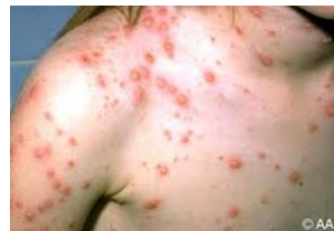
Trược trong mình

Tham mê danh vọng, sống bất an Nó khiến cho ta, phải bệnh tình Bao nhiêu tiền của, đều mất hết Âm thâm tu điển, giải nạn tai