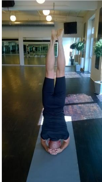
Thân Quân Bình Thành Lợi