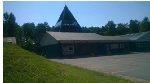
11 Năm hoạt động Trung Tâm Thiền VN Vô Vi Điển Quang Trường Sanh Học Denmark

Tu thiên mở khiếu, điển huyền quan Giác ngộ tâm linh, phải hành thiên Nắm lấy pháp thiên, tu trung chánh Đêm ngày tâm nguyện, niệm nam mô