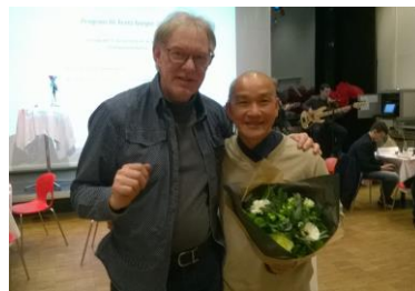
Được tuyên dương người làm thiện tốt trong năm

Đó đây sum hợp, một tấm lòng Vì tình đồng loại, phải giúp nhau Giải toả trước trần, lan khắp chốn Giúp người khoẻ mạnh, giải nghiệp oan