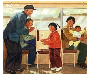
Trung hiếu trong nhà