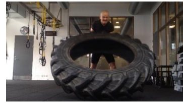
Trước kia con rất yếu

Kỳ tài hội ngộ, gặp gỡ nhau Phật pháp cao sâu, giải rõ ràng Bác cứ đàng hoàng, tu nghiêm chỉnh Điển đạt tâm minh, hiểu cả Trời