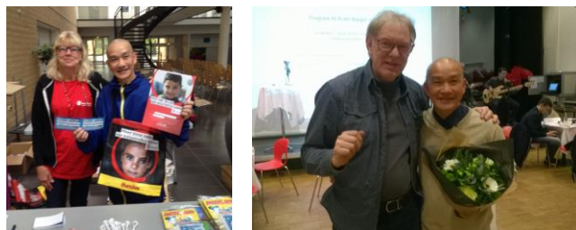
Quyên tiền cứu giúp trẻ em tật nguyền

Cứu khổ ban vui, giải mối sầu Cho người nhân thế, tránh bệnh đau Đi tu giải thoát, về Thiên Quốc Trợ điển nhân sinh, thoát ngục tù