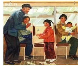
Kính trên, nhường dưới và ôn hoà

Đừng nên dùng lưỡi, hại người ta Phải nên gìn giữ, học nhẫn hòa Nó giúp cho mình, tâm, khẩu tốt Cẩn rằng, niệm Phật, Phật sẽ ban