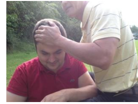
Bồ Tát hạnh là chữa bệnh giúp người

Hành thiền thực hiện, tánh yêu thương Chăm lo giúp đỡ, đến mọi người Tánh thiện của mình, nên nung nấu Lâu dần nhân tánh, đạt điển thanh