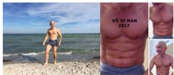
Phật cho tam liễu, Tinh, Khí, Thần đầy đủ

Pháp này là của, Phật truyền ra Giúp cho mình đạt, tánh ôn hoà Bạn cứ tận tình, tu theo pháp Làm tinh mật niệm, Phật thiết tha