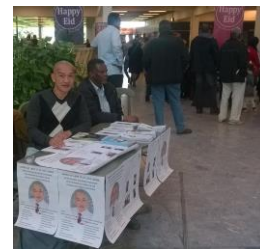
Bồ Tát hạnh, làm việc thiện, quảng cáo pháp thiền ngoài công chúng

Đừng nên xao lãng, việc công phu Điển lực quy nguyên, việc tối cần Giúp bạn loại trừ, ma tâm chướng Hưởng phước hồng ân, Đức Phật Đà