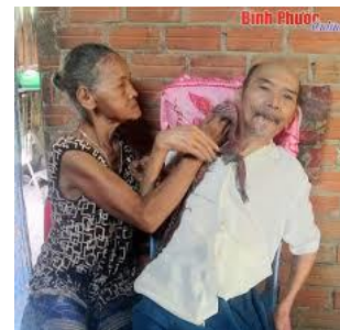
Không tu luyện, ai cũng bị yếu Bao Tử, đau đường ruột, khó ăn uống, khó tiêu hoá, ngủ không an giấc