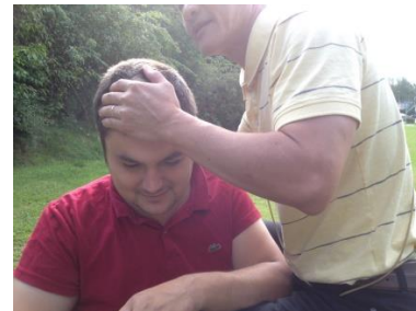
Chữa trị bệnh não loạn tiền đình

Cây đức hạnh, ngàn năm không héo Nó chỉ cần, dung dưỡng âm dương Thế nên khổ nhục, ở trong lòng Vui cười tự tại, tu thiện sẽ qua