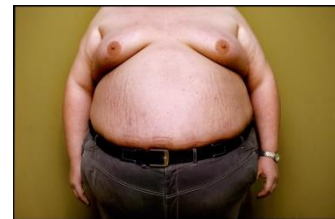
Ruột và Bao Tử cần thanh lọc

Khi mình luyện thiền, hít thở điển quang, uống