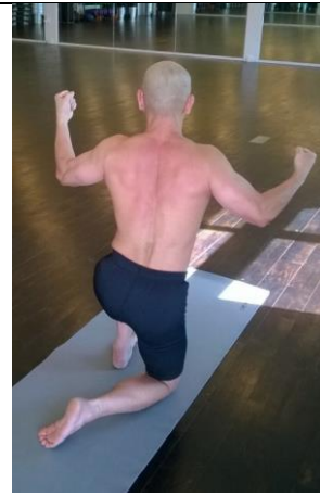
Sự thật con xin trình