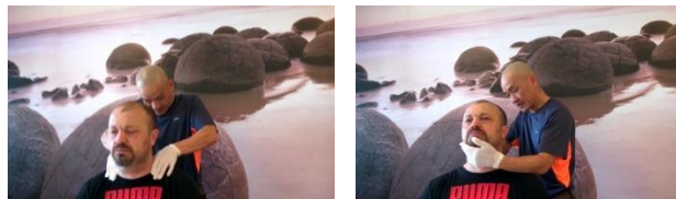
Chữa khỏi bệnh bướu sau gáy Bác sĩ khuyên giải phẫu

Tu thiên phải khoẻ, nhẹ hơn xưa Chớ nên để ý, chuyện quanh mình Cá tánh của mình, hay tranh chấp Thần hồn não loạn, bệnh tứ tung