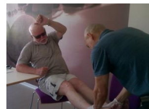
Bệnh nhân tặng tiền mua găng tay, dầu nóng