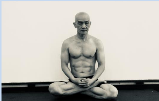
Thiền Tu Thanh Tĩnh