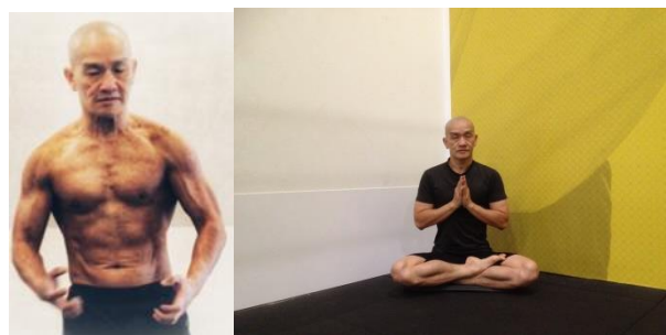
Tim gan dịu mát, mình phải thiền, để cho luồng điển mình thanh nhẹ

(Tu đúng, tâm và thân khoẻ mạnh, mặt sáng thông minh)