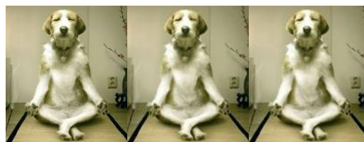
Con chó mình cũng thương, đúng không.

Ngạo mạn công cao, tạo cực hình Hãy nhìn dung điểm, sẽ tổn kinh Hơn thua tranh chấp, sanh hiểm tị Kỳ thị con người, bệnh sẽ căn