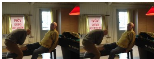
Trị bệnh miễn phí và khuyên người ta tu

Tránh xa bệnh tật, phải tu thiền Sống nhất là thiền, chẳng tốn xu Thanh quang ban chiếu, cho người thiện Học pháp tu thiền, giải thoát mau