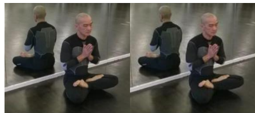
Thiền trong thanh tịnh

Thật lòng nhắc nhở, với chúng sanh Trước khí hoàn hành, khắp thế gian Mình nên dành chút, đỉnh thời giờ Tu luyện cho mình, tránh bệnh đau