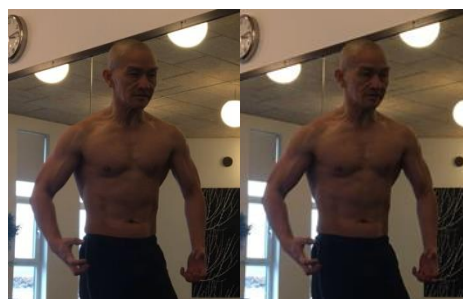
Xưa kia tôi cũng bệnh liên tục mỗi khi thời tiết thay đổi Tu một thời gian thay đổi

Có duyên mới gặp, được chơn thiền Giúp người hoá giải, những buồn đau Chăm lo tu tịnh, hành chơn pháp Giải trước về thanh, hết bệnh tình