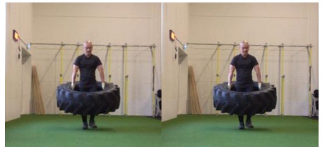
Sức khoẻ và tâm linh

Tu thiên cuộc sống, rất an yên Tâm trí thanh cao, bớt chuyện phiền Thân thể dung hoà, trong cuộc sống Bệnh hoạn tiêu trừ, khoẻ sống lâu