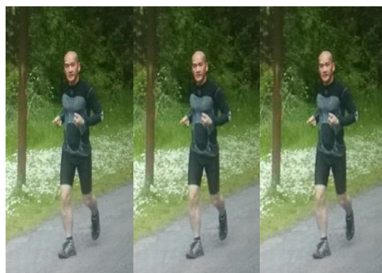
Tôi chạy bộ 12.575 km trong hai năm rưỡi Vòng quanh trái đất 40.000 km.

(Bạn phải thật lòng làm đúng pháp, như tôi chỉ, đừng có tu nửa chừng)