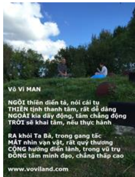
Thổ thần mời tôi thiên ngoài cộng đồng

Điển chiếu nơi đây, rất thật thà Huyền bí trong mình, sẽ hiện ra Ánh sáng tu thiên, luôn bật sáng Cho người tu luyện, pháp trường sanh