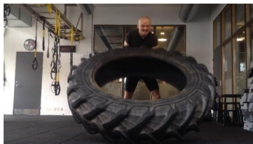
Tu Vô Vi điển quang, luyện tinh khí thần

Tu thiên sẽ giải, được nghiệp duyên Thanh điển Trời ban, giúp mình hiền Vượt qua các cõi, nhờ tự thức Gỡ mỗi tơ lòng, đã thắt sâu