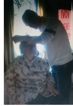
Chữa bệnh nhức đầu kinh niên cho bà cụ

Thực hành đúng đắn, sẽ mở ra Điển tâm thanh tịnh, ở đỉnh đầu Hướng thượng hành thiên, tu sám hối Bề trên sẽ chiếu, giác ngộ sai