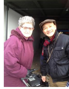
Giúp những người lớn tuổi ở chung quanh

(Phương pháp thiền và hít thở điển quang uống thuốc Phật, xem trong trang, phương pháp hành thiền. www.voviland.com )