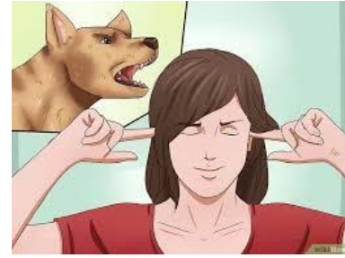
Mình tu thì bị..

(Phương pháp thiền và hít thở điển quang uống thuốc Phật, xem trong trang, phương pháp hành thiền. www.voviland.com )