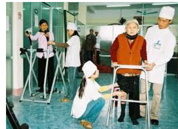
Tránh bệnh đau, mình nên tu thiền điển quang

Ban đêm thiền thì điển mình nó nói tiếp với điển thiên không