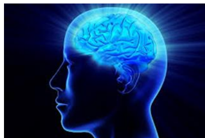
Tu Vô Vi, thiên ban đêm bộ đầu phát quang

(Uống thuốc Phật, uống nước lạnh âm dương Vô Vi mỗi buổi sáng thì bụng tránh ung thư ruột, máu tốt, da đẹp)