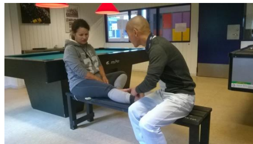
Chữa bệnh phong thấp miễn phí

(Thế giới Phật Tiên, cứu người, giúp người)