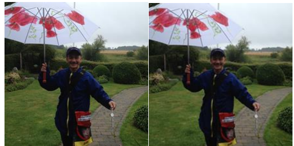
Đi trong mưa gió, quên tiền giúp đỡ trẻ em, nghèo và bệnh tật trên thế giới

Ánh mắt từ bi, chiếu sáng người Nhìn đời cuộc sống, thật nên thơ Bước đi của Bạn, còn in dấu Lữ khách độc hành, niệm nam mô