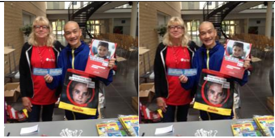
Quyên tiên, được tặng bằng khen

(Bạn phải thật lòng làm đúng pháp, như tôi chỉ, đừng có tu nửa chừng)