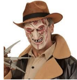
Tâm ma đã chiếm phần hồn

Tâm người vì quá tham lam Sanh ra mưu kế, lọc lừa hại nhau Tâm ma đã chiếm phần hồn Ăn năn sám hối, Phật Trời sót thương