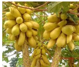
Bồ Tát là đây

Linh hồn cây cỏ, Thượng Đế ban Dung dưỡng phát quang, sống hùng hồn Giúp đỡ cho người, không dấy động Hào quang ánh sáng, thượng giới ban