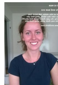
Hoa Sen hoá kiếp thành Cô Sen, có Cô tên Mai, Lan...