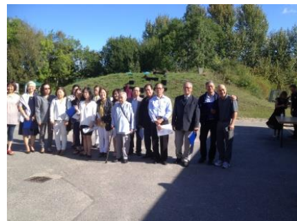
Ra mắt ngoài cộng đồng bạn

(Bạn phải thật lòng làm đúng pháp, như tôi chỉ, đừng có tu nửa chừng)