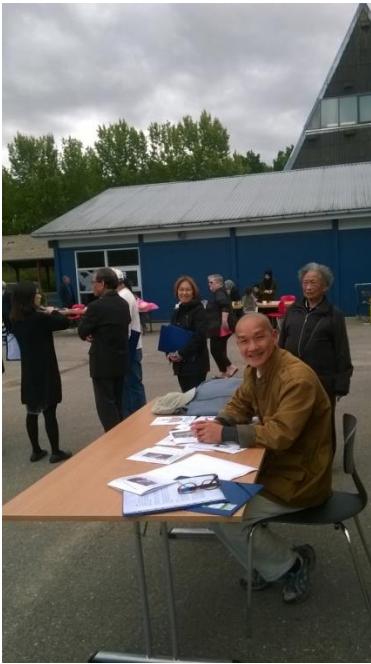
VIETNAM VÕVI ENERGI MEDITATION 2015