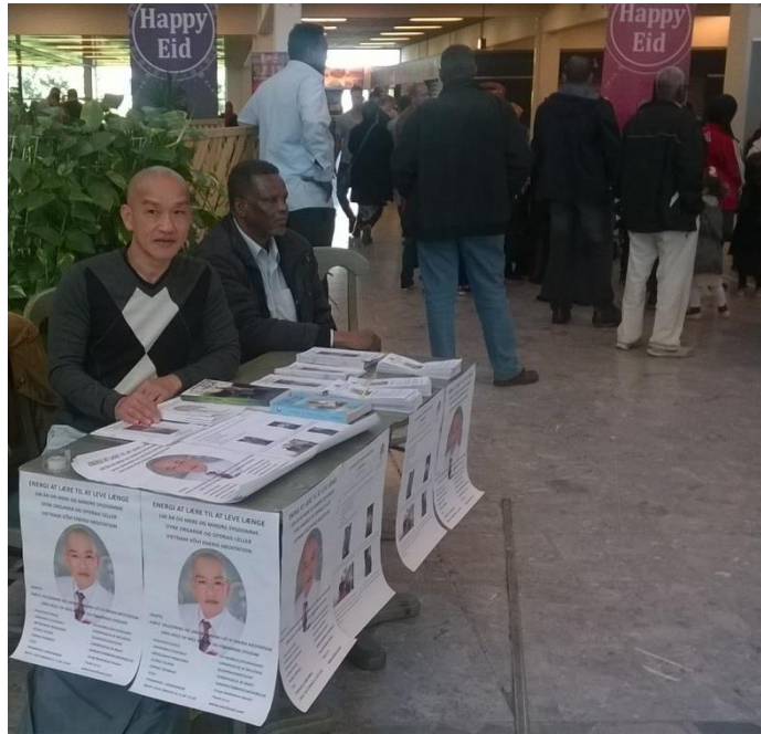
VOLLSMOSE CENTER MÙA HÈ 2015