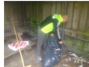
Ra công hành thiện

Bệnh hoạn làm sao, giúp được đời Nhìn vào thế sự, lại chơi với Pháp lực điển thiên, tu trung chứng Trong ngoài hành pháp, rõ tường chơn