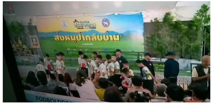
Vẻ ra chương trình cứu 13 nạn nhân, bị kẹt trong hang động Thái Lan Được toà đại sứ cảm ơn 2018

Càng tu càng khoẻ, trẻ hơn xưa Điển năng pháp Phật, giúp mình hiền Tu tịnh tham thiền, tâm ngời sáng Ánh quang đạo phát, thật trong tâm