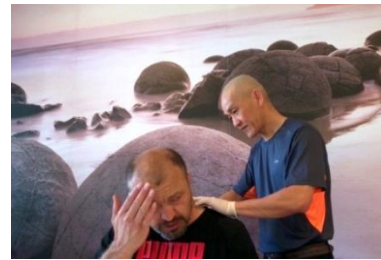
Trị bệnh miễn phí

Tu hành chẳng có thấp cao Người tu đi trước, dìu người đi sau Cần khôn vũ trụ chung tàu Cùng chung một tánh, quý thương muôn loài