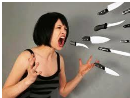
Lời nói như súng, đạn, gươm, đao

(Phương pháp thiền và hít thở điển quang ổng thuốc Phật, xem trong trang, phương pháp hành thiền. www.voviland.com )