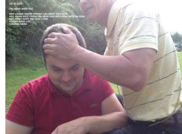
Chữa bệnh đau đầu nhiều năm, miễn phí

(Phương pháp thiền và hít thở điển quang uống thuốc Phật, xem trong trang, phương pháp hành thiền. www.voviland.com )