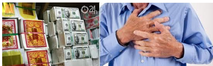
Tiền nó làm cho người ta bệnh đau.