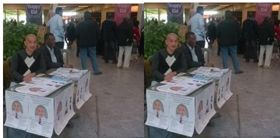
Quảng bá pháp thiền ngoài công chúng

Thời này hành động, cứu tâm linh Ước mong quý Bạn, nhớ thực hành Tu chính cho mình, thanh điển tốt Ngày ngày tu luyện, nhớ trung kiên