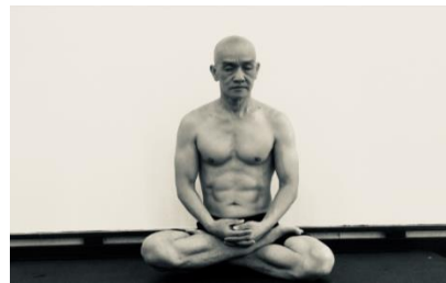
Tu rất đơn giản, không cầu kỳ, ngồi thiền vậy thôi