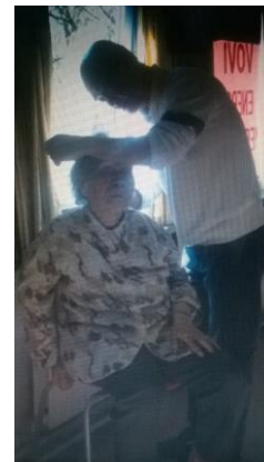
Chữa khỏi, bệnh nhứt đầu kinh niên mấy chục năm, miễn phí, nhưng Bà cho tiền thù lao

Tu thiền Phật sẽ giúp cho Điển quang sẽ giúp, cho mình hiền Những chuyện trên đời, không cần thiết Lo mình tu sửa, khoẻ sống lâu