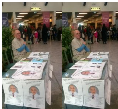
Quảng bá pháp thiền ngoài công chúng

(Phương pháp thiền và hít thở điển quang uống thuốc Phật, xem trong trang, phương pháp hành thiền. www.voviland.com )