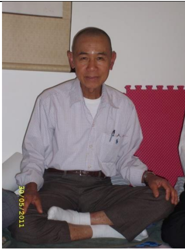
Hình chú Huệ Thái ở Mỹ