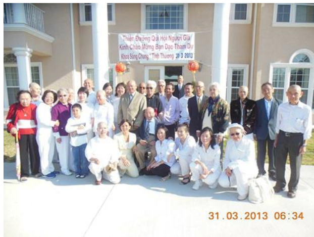
Bạn đạo Vô Vi ai cũng có HÀO QUANG