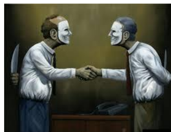
Thị trường quốc tế, giao thương