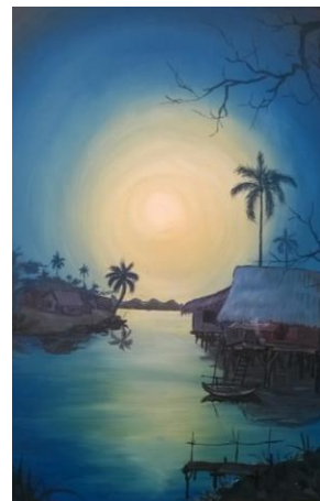
Tranh sơn dầu, cảnh này tôi vẽ lại lúc vượt biển

(Uống thuốc Phật, uống nước lạnh âm dương Vô Vi mỗi buổi sáng thì bụng tránh ung thư ruột, máu tốt, da đẹp)