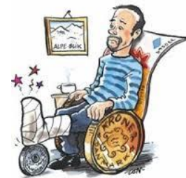
Tai nạn bất thường

(Bạn phải thật lòng làm đúng pháp, như tôi chỉ, đừng có tu nửa chừng)