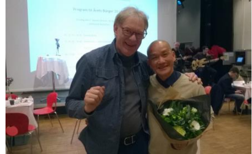
Tôi được cơ quan xả hội vinh danh người làm việc thiện

(Phương pháp thiền và hít thở điển quang uống thuốc Phật, xem trong trang, phương pháp hành thiền. www.voviland.com )