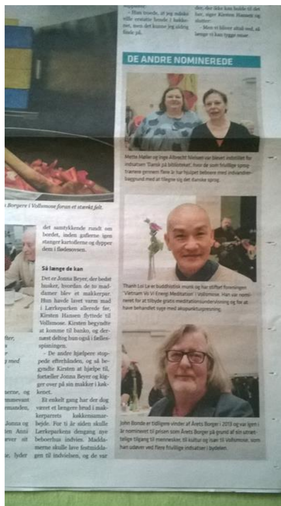
Tôi làm việc thiện, chữa bệnh, dạy thiền miễn phí, cơ quan xả hội vinh danh, đăng tải trên báo

Cách Bào Chế Thuốc Trị Ung Thư Xem số báo 227.