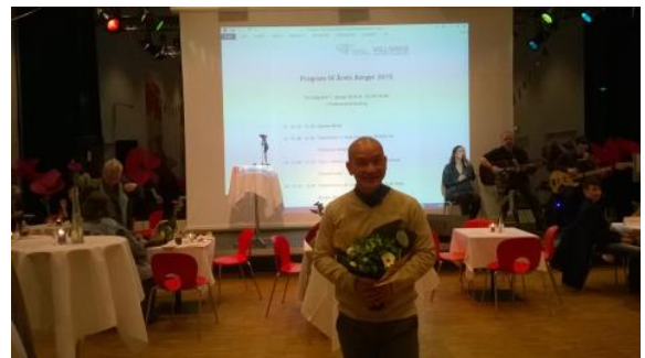
Tôi được cơ quan xả hội vinh danh người làm việc thiện

Mất đi nhuệ khí, của người tu Tinh hoa Phật pháp, lại tối mù Bán rẻ linh hồn, cho ma quỷ Lo tu tạo lại, chí hùng anh