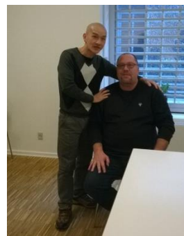
Chữa bệnh miễn phí

Chiêm bao mộng mị, giúp mình tu Thực hiện tình thương, hướng chỉ đường Ganh ghét giận hờn, không tranh chấp Thiền hành xoá bỏ, chuyện hôm qua