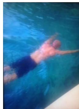
Tôi lặn một hơi xa 49 m. Tim phổi khoẻ và luyện được.

Điển quang mật thiết, với chúng ta Nếu Bác thiết tha, sống học hoà Thanh điển của mình, luôn ngời sáng Hiểu Trời, hiểu Phật, hiểu sanh linh