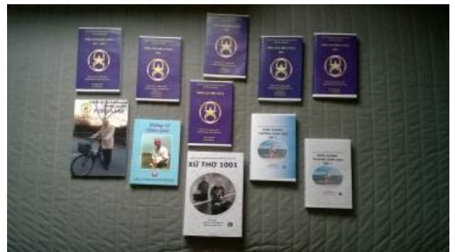
Điển hoá văn

Pháp này giúp cho mình, giải thoát và sống thọ