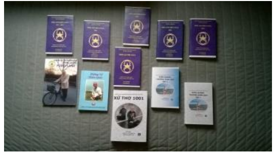
Điển hoá văn

Pháp này giúp cho mình, giải thoát và sống thọ