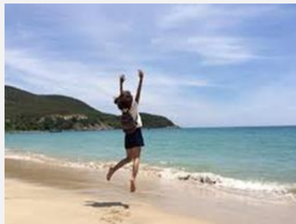
Bằng Hữu Thành Lợi Lê

Cách Bào Chế Thuốc Trị Ung Thư Xem số báo 227.