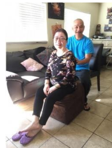
Trị bệnh cho gia đình Cali 11/2019 Đau lưng, thuốc uống không khỏi

(Bạn phải thật lòng làm đúng pháp, như tôi chỉ, đừng có tu nửa chừng)