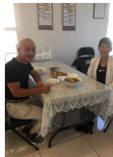
Tịnh Khẩu, Niệm Phật Cali 11/2019

Không gian rộng lớn, chứa tí Sao Ngắm cảnh Thiên Hà, lại ngộ tao Chư Tiên, chư Phật, thường tới đó Tắm gội chơn linh, thọ điển Trời