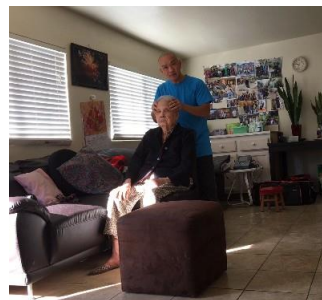
Trị bệnh cho gia đình Cali 11/2019 Nhức đầu, máu cao, máu thấp

Ngồi thiền thanh tịnh, học Nam Mô Cứ thể tiến vô, thức luyện đào Tâm tánh của mình, luôn lặng nín Nam mô tâm nguyện, tự bước Vô