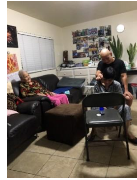
Trị bệnh cho gia đình Cali 11/2019 Trúng gió, 30 phút sau, làm việc trở lại bình thường

(Uống thuốc Phật, uống nước lạnh âm dương Vô Vi mỗi buổi sáng thì bụng tránh ung thư ruột, máu tốt, da đẹp)