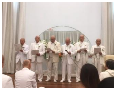
Cali 11/2019 ngày giỗ Tổ

Siêng năng thành thật, quyết tâm thiền Đừng dính duyên tiền, bệnh sẽ tan Tham lam ích kỉ, xa rời tránh Tu tâm dưỡng tánh, tránh bệnh tình