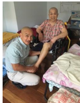
Chữa bị tai biến, đột quỵ Trụ sở Vô Vi Cali 11/2019

(Phương pháp thiền và hít thở điển quang uống thuốc Phật, xem trong trang, phương pháp hành thiền. www.voviland.com )