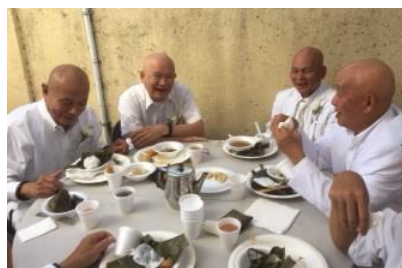
Cali 11/2019 ngày Giỗ Tổ

(Bạn phải thật lòng làm đúng pháp, như tôi chỉ, đừng có tu nửa chừng)