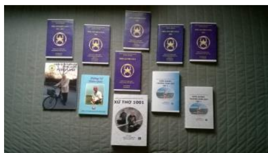
Điển hoá văn

Pháp này giúp cho mình, giải thoát và sống thọ