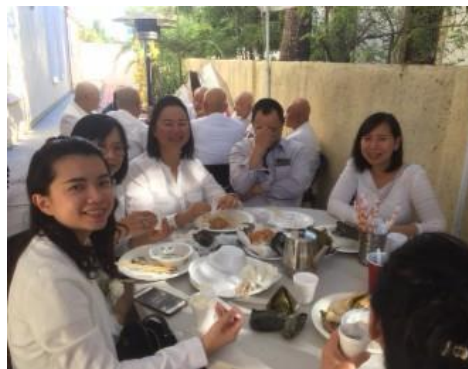
Ngày giỗ tổ Đức Ông Tư Cali 11/2019

(Uống thuốc Phật, uống nước lạnh âm dương Vô Vi mỗi buổi sáng thì bụng tránh ung thư ruột, máu tốt, da đẹp)