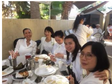
Cali 11/2019 ngày Giỗ Tổ

Điển quang sẽ chiếu, nếu thật thà Tu pháp Di Đà, sẽ nhận ra Điển quang của Phật, thường cấp phát Cho người thành Phật, sống với ta