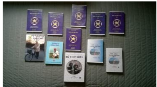
Điển hoá văn

Pháp này giúp cho mình, giải thoát và sống thọ