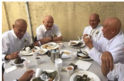
Cali 11/2019 ngày Giỗ Tổ

(Bạn phải thật lòng làm đúng pháp, như tôi chỉ, đừng có tu nửa chừng)