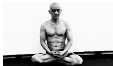
Thời này tu, ĐIỂN, TÂM, THÂN QUÂN BÌNH

Bệnh tim sẽ hết, nếu mình làm Thân người sẽ nhẹ, tựa như mây Kinh mạch thông đường, mình mới hiểu Pháp thiên chỉ rõ, dứt bệnh căn