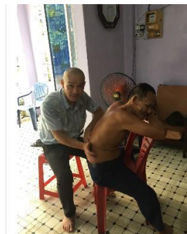
Trị bấu lưng, to bằng nắm tay

Tu tâm sửa tánh, tránh nạn tai Làm lành tránh ác, sẽ gặp may Tương lai sáng lạ, hành tu sửa Vô Vi khai triển, điển linh quang