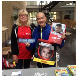
Phước huệ song tu

(Bạn phải thật lòng làm đúng pháp, như tôi chỉ, đừng có tu nửa chừng)