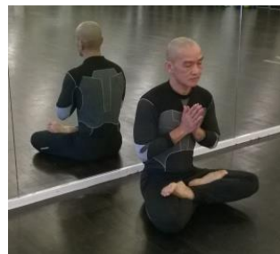
Ngồi thiền sám hối, hấp thụ điển quang ban đêm

(Uống thuốc Phật, uống nước lạnh âm dương Vô Vi mỗi buổi sáng thì bụng tránh ung thư ruột, máu tốt, da đẹp)