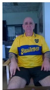
Giúp tu thiền và trị ngoại trị miễn phí

(Phương pháp thiền và hít thở điển quang uống thuốc Phật, xem trong trang, phương pháp hành thiền. www.voviland.com )