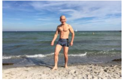
Tu tâm, tu thân và tu điển, phát triển nhanh

Bác dùng tâm điển, của Phật gia Tu luyện tại gia, pháp Di Đà Thanh tịnh tu thiền, hành trong động Nổi sâu biển mất, Phật dị tha