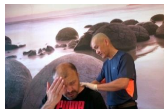
Chữa bệnh não loạn tiên đình miễn phí, nhứt đầu kinh niên

Giàu nghèo tâm bệnh, tật phải mang Nghệp chướng không tu, khó giải trừ Tu luyện cho mình, mình tâm pháp Giải hết tâm can, dứt nỗi sầu