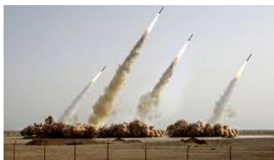
Tham lam, gây ra chiến tranh

(Phương pháp thiền và hít thở điển quang uống thuốc Phật, xem trong trang, phương pháp hành thiền. www.voviland.com )