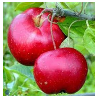
Trái cây có hào quang