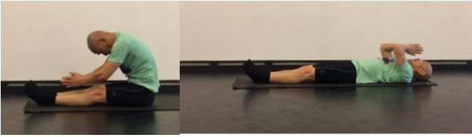
Thể dục Di Đà, lạy nằm trị bá bệnh, tim, cao máu, đau lưng, cờ bạc, uống rượu, nóng tánh, ung thư...