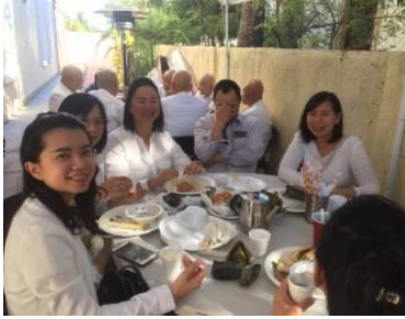
Người vui tươi có hào quang