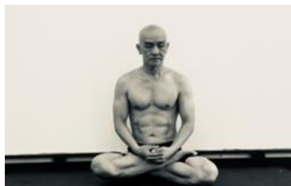
Tu tâm, tu thân và tu điển, phát triển nhanh

. Pháp thiền này giúp cho mình sống thọ và giải thoát