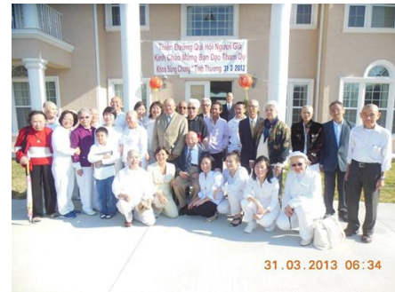
Hào quang Bạn Đạo