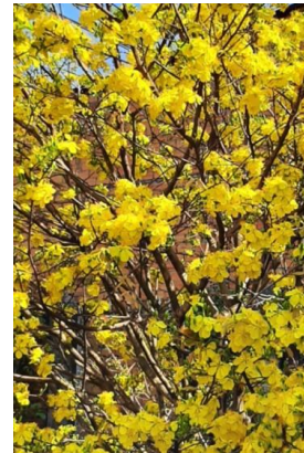
Cây mai có hào quang