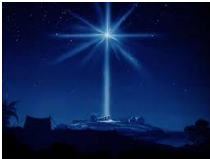
Nhật, Nguyệt phát hào quang