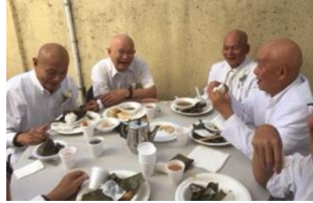
Hào quang Bạn đạo