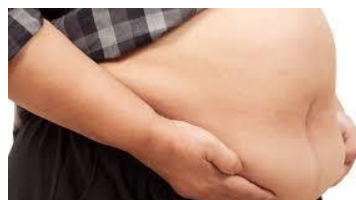
Thân nặng, trước, có hại tâm lẫn thân

Tu hành rượu thịt, khó tiến tu Đạo lý âm u, thích bạc tiền Âm thực cho nhiều, sanh cao máu Bệnh hoạn do mình, khổ vì tham