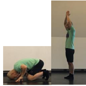
Mỗi sáng, mình lạy 8 lạy, trị bá bệnh