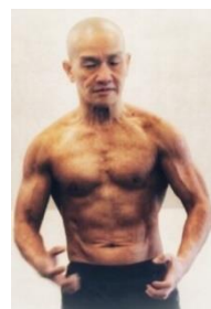
Xưa kia tôi bệnh bốn mùa

Tâm buồn tìm kiếm, học pháp tu Giải toả phiền ưu, thấy nhẹ lòng Nhờ có pháp thiền, tu điển giải Giúp cho tâm nhẹ, giải bệnh đau