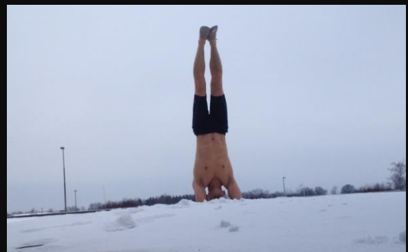
Cây Nguyên Linh