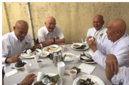
Bạn đạo Cali

(Bạn phải thật lòng làm đúng pháp, như tôi chỉ, đừng có tu nửa chừng)