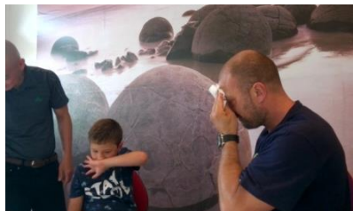
Cha thần kinh, đau đầu nhiều năm và con điếc, chữa miễn phí

(Uống thuốc Phật, uống nước lạnh âm dương Vô Vi mỗi buổi sáng thì bụng tránh ung thư ruột, máu tốt, da đẹp)