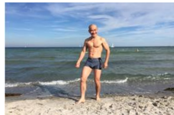
Tu điển quân bình, tâm và thân thay đổi

Văn minh pháp Phật, giúp nhơn thiên Sống lâu khoẻ mạnh, khỏi bệnh đau Trí óc con người, luôn phát triển Không tham ganh ghét, sống thanh bình