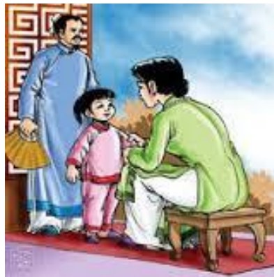
Ông Bà Cha Mẹ đại diện Trời Phật Chúa

(Phương pháp thiên và hít thở điển quang uống thuốc Phật, xem trong trang, phương pháp hành thiên. www.voviland.com )