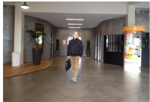
Thành Quả 14

Vía hồn chìm đắm, ở biển sâu Thông minh cho mấy, cũng phải sâu Khí thể anh hùng, bay đi mất Khi mà tai biến, gặp bệnh đau