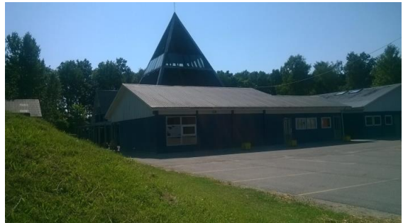
Thành Quả 17 Trung Tâm Sinh Hoạt Vô Vi

Chất này nó ẩn, ở máu xương Thế nên tu luyện, điển Phật Trời Hít thở cho đều, thông nội tạng Ngày ngày điều luyện, pháp tu thân