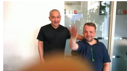
Thành Quả 15

Trọn thức hoà đồng, quý chúng sanh Ai ai cũng tốt, giúp đỡ mình Không lẽ vô tình, đi mất dạng Tận tụy hy sinh, giúp đỡ người