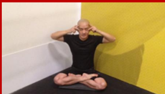
Siêu Pháp Soi Hồn Thành Lợi Lê