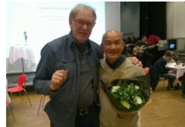
Thành Quả 10

(Bạn phải thật lòng làm đúng pháp, như tôi chỉ, đừng có tu nửa chừng)