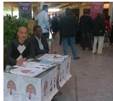
Thành Quả 16

Sống trong thế giới, cứu giúp người Con người sẽ được, quý trọng yêu Ai ai cũng mến, tâm hiền đức Kính mến thương yêu, chớ hại người