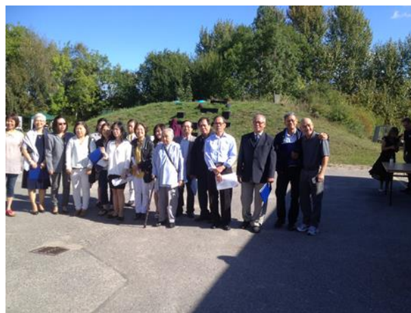
Thành Quả 13

Thổ thần mời, biểu diễn ngôi thiên ngoài cộng đồng