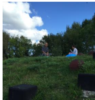
Thành Quả 12

Trên Trời dưới Đất, giúp đỡ ta Chung quanh hộ độ, giúp Bạn thiên Phải lấy tâm bình, tu chánh khí Thành tâm cảm tạ, đức ân sâu