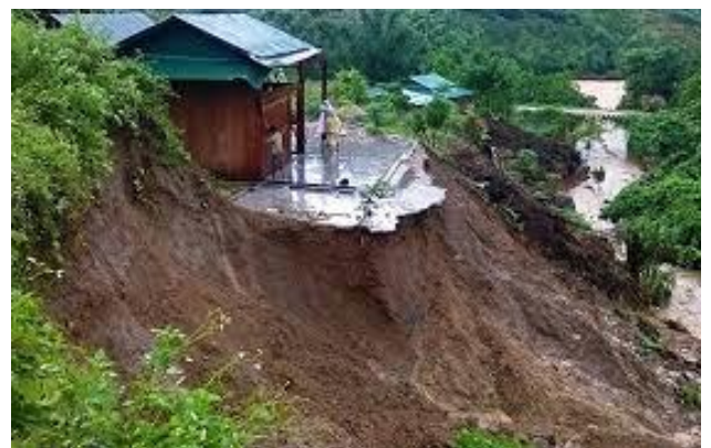
Long Trời lở đất

Nạn tai, tai họa, ở tiệc tùng Thần khẩu con người, thật là ghê Không tu nó chạm, vào khối óc Bạn phải tu thiền, tránh bệnh căn