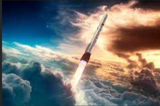
LONG TRỜI LỞ ĐẤT