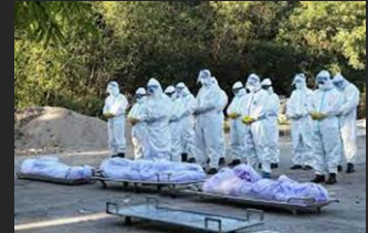
XÁC CHẾT COVID