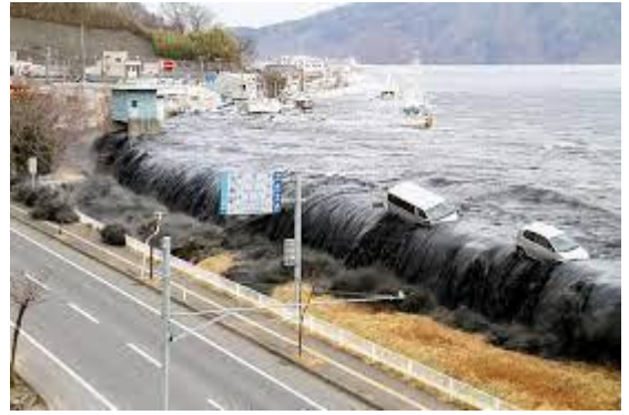
Long Trời lở đất

(Phương pháp thiền và hít thở điển quang uống thuốc Phật, xem trong trang, phương pháp hành thiền. www.voviland.com )