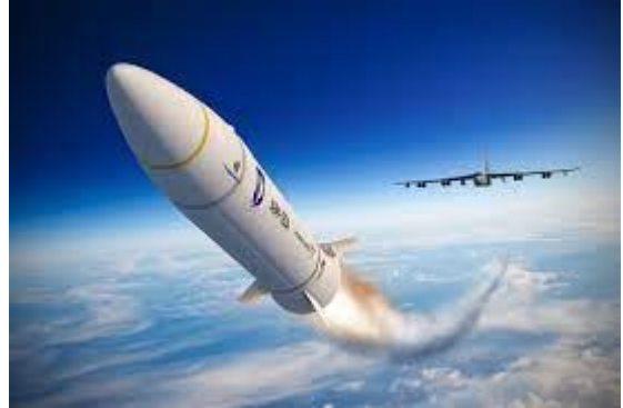
Long Trời lờ đất

(Bạn phải thật lòng làm đúng pháp, như tôi chỉ, đừng có tu nửa chừng)