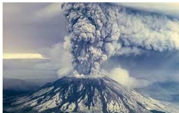
Long Trời lở đất

Tu thiên cuộc sống sẽ an yên Trí tâm thanh cao, bớt chuyện phiền Thân thể dung hoà, trong cuộc sống Bệnh hoạn tiêu trừ, khoẻ sống lâu