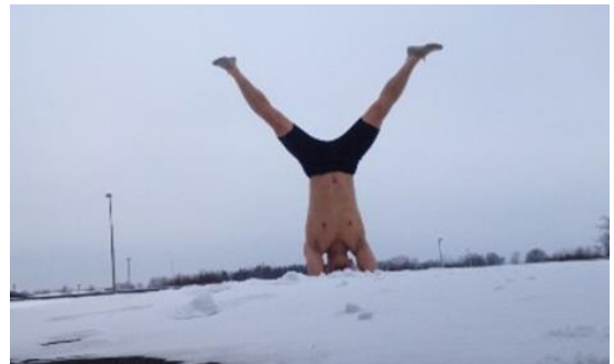
Ngày xưa tôi bệnh bốn mùa, tâm và thân quân bình

Chung tình lòng tốt, ruột tim gan Ở đây giúp Bạn, tránh cảnh nghèo Không nên phụ bạc, trong thời khó Cái cảnh thanh bình, sẽ hiện ra