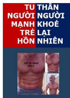
Lúc trẻ tôi bị bệnh bốn mùa

Tu thiên Bác sẽ, khoẻ, tâm minh Phương pháp giản đơn, sáng tối hành Cứ thể mình làm, không tốn bạc Trường sanh pháp Phật, giúp mình thông