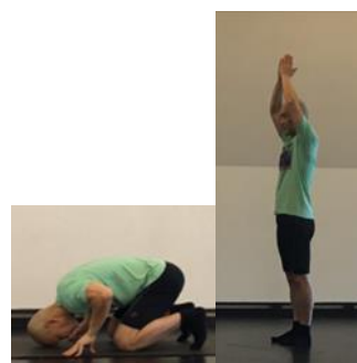
Mỗi sáng, mình lạy 8 lạy, trị bá bệnh