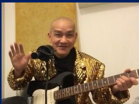
Siêu Pháp Soi Hồn Thành Lợi Lê