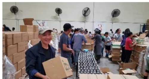
Giúp đóng thùng 500 phần quà cho người nghèo tại Cali

Bề Trên Trời Phật, giúp Vô Vi Che chở cho ta, tránh bệnh tình Nạn lớn hoá thành, tai nạn nhỏ Bạn cứ âm thầm, sửa tánh nhu