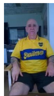
Tu thiên điển quang 3 tháng, hết bệnh liệt dương

(Phương pháp thiên và hít thở điển quang uống thuốc Phật, xem trong trang, phương pháp hành thiên. www.voviland.com )