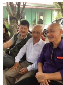
Bạn đạo Việt Nam

(Bạn phải thật lòng làm đúng pháp, như tôi chỉ, đừng có tu nửa chừng)