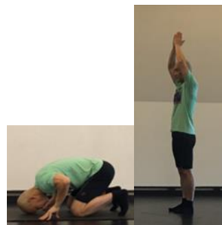
Mỗi sáng, mình lạy 8 lạy, trị bá bệnh