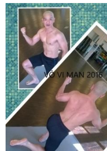
Xưa kia tôi bệnh bốn mùa

Tu thiên cuộc sống sẽ, an yên Tâm trí thanh cao, bớt chuyện phiền Thân thể dung hoà, trong cuộc sống Bệnh hoạn tiêu trừ, khoẻ sống lâu