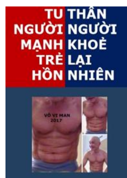
Lúc trẻ tôi bị bệnh bốn mùa

Giải trước trong người, nó khoẻ ra Về nhà niệm Phật, nó trẻ ra Không tu, khó thoát, đường tà khí Ý chí tu hành, dũng dựng xây