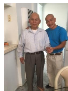
Chữa bệnh phong thấp Bạn đạo Cali

Ấn đường hiện dấu, ấn Phật ban Đánh dấu tâm, can, Phật pháp truyền Quy hội chơn hồn, trong điển giới Trở về Phật quốc, rõ hồn ta