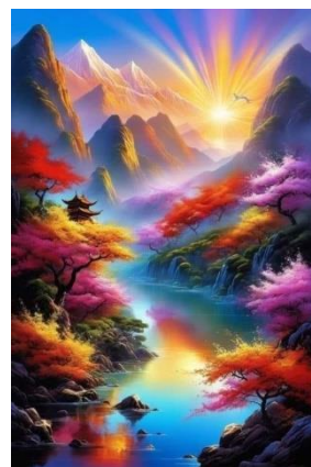
Ngũ hành màu sắc đẹp xinh Phát ra vẻ đẹp, thanh quang của Trời

luyện Chuyên* chuyên gia tu, chuyên gia niệm Phật