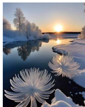
Tranh Trời vẽ đẹp hồn nhiên Trong ta cũng có, hồn thơ với Trời

Hành thiên khổ cực, thấy ngộ vui Cái không hoá giải, mọi sai lầm Khổ đến với ta, đều vui vẻ Phước đức điển lành, Phật không xa