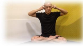
Công phu dành dụm điển quang

Quý nhất con người, điển linh quang Cố gắng mình tu, sẽ đạt nhiều Công đạo tu hành, thiền tự giác Mỗi ngày dành dụm, điển hào quang